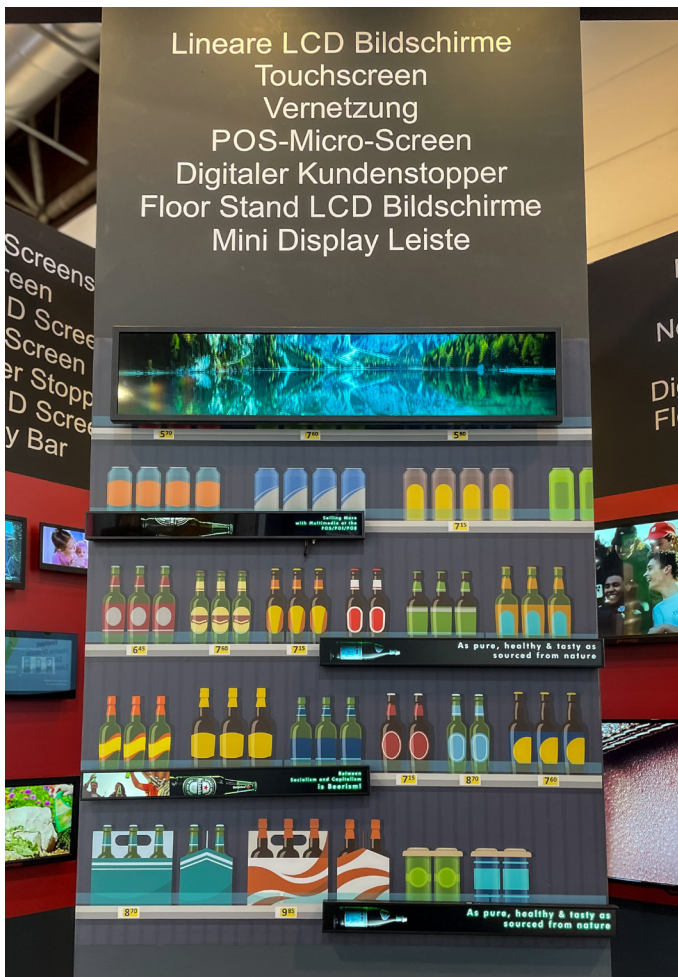
Mediensysteme in den Größen von 7“ bis 55“ mit Touch-Funktion.

Besonders großes Interesse gilt aktuell den Regal LCD Bildschirmen von Permaplay (P23KD01LCDBAR) mit eingebautem interaktivem System auf Android-Basis: Diese schaffen eine hohe Aufmerksamkeit am POS und animieren die Produkte direkt auf Augenhöhe unterhaltsam für eine positive Kaufentscheidung. Die Updates erfolgen ganz einfach per USB-Stick, WLAN oder über die Cloud. Aber auch Nachhaltigkeit war auf der EuroShop